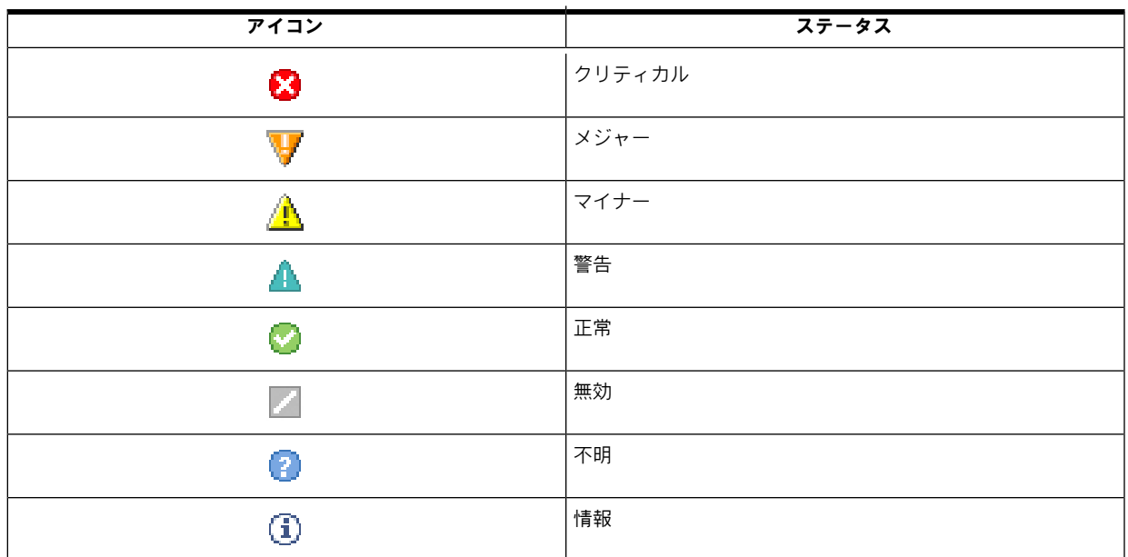
表 3-1 ステータス アイコン